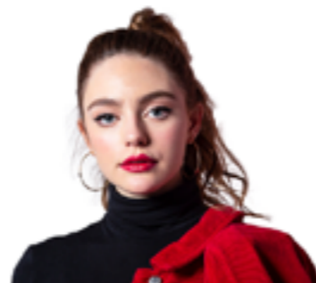
Danielle Rose Russell